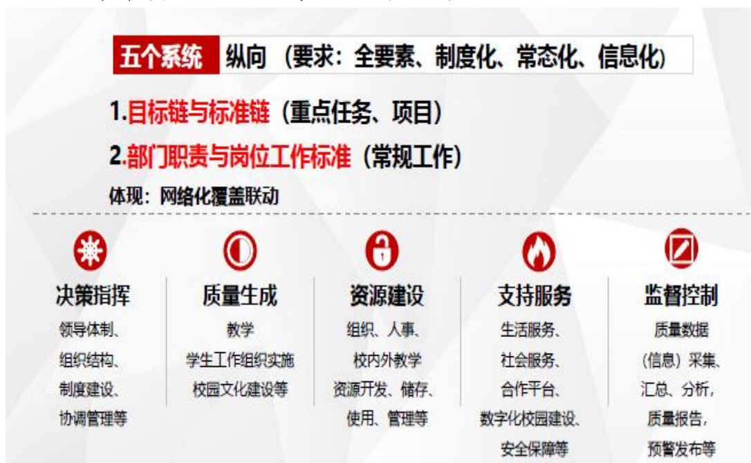
(图一：纵向五系统基本架构图)