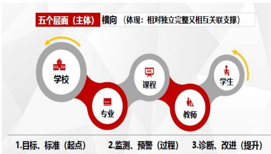
(图二：横向五层面基本架构图)